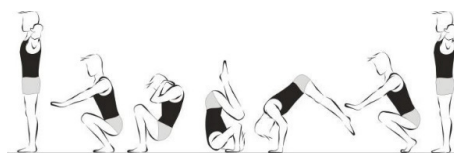
Rolamento à retaguarda (10%)