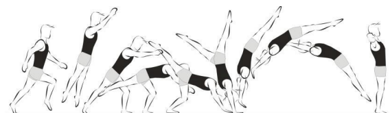
Salto de mãos à frente (10%)