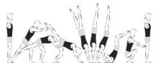
Apoio facial invertido, com rolamento à frente (20%)

Construa uma sequência, com as diversas figuras, de forma a obter no mínimo 60% de média do valor global dos elementos técnicos.