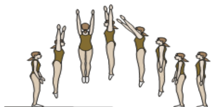
Salto em extensão com ½ pirueta (5%)