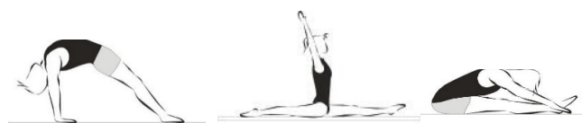
Posição de flexibilidade (ponte, espargata, 'sapo') (10%)

Dos últimos dois elementos o candidato escolhe uma posição de equilíbrio e uma de flexibilidade.